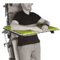
6040204 + 5432402 Tisch + Polsterauflage