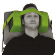
6040106 Kopfstütze fixierend