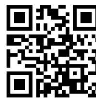
Mobilizer® Medior HomeCare