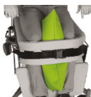
6040116 Positionierungs- polster